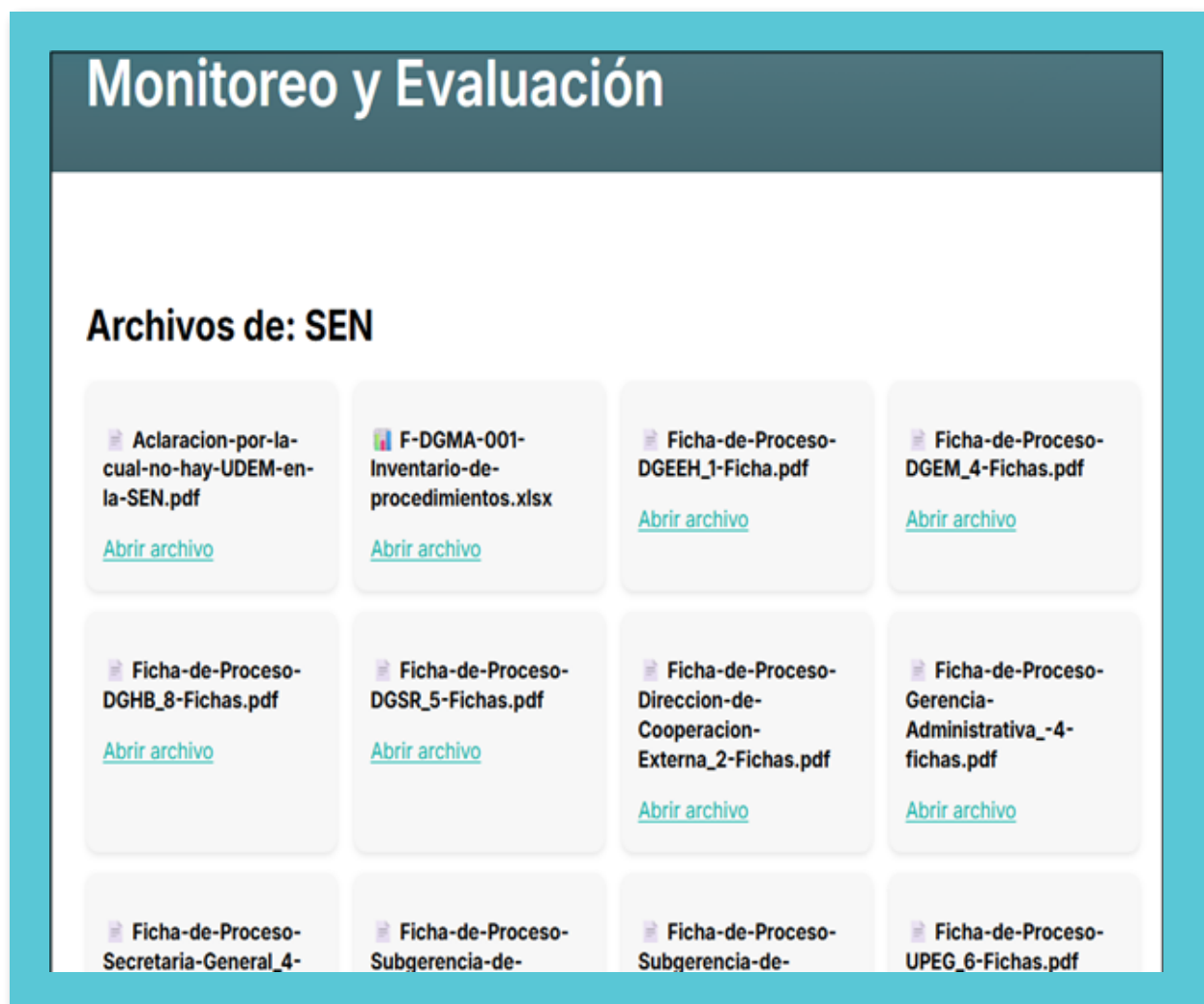
Ilustración 2: Captura de pantalla de la información cargada en la plataforma SIGI

Como parte de la modernización y simplificación bajo directrices emanadas de la Dirección General de Modernización Administrativa (DGMA), la Secretaría de Energía ha cargado en la plataforma Sistema Integral de Gestión de la Innovación y Calidad Institucional (SIGI), documentos claves que describen el accionar de esta Secretaría, esto para una revisión de la gestión para garantizar la optimización operacional de la SEN.