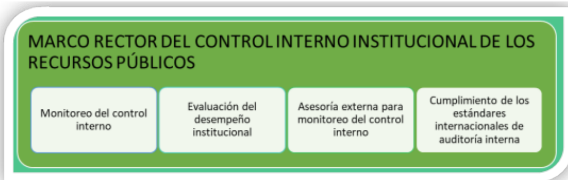
Ilustración 1: Esquema de la Supervisión y Monitoreo

La supervisión y monitoreo del control interno debe asegurar, por medio de la evaluación de los controles, que estos operen de la forma que se requiere, planificadamente y que sean actualizados de acuerdo con los cambios en las condiciones internas y externas de la entidad. La supervisión y monitoreo valora el cumplimiento de la misión y si se alcanzan los objetivos de control interno relacionados con las operaciones, la información y el cumplimiento. Esto se logra por medio del seguimiento continuo, las evaluaciones separadas, o la combinación de ambas, para asegurar que el control interno siga siendo aplicable en todos los niveles y en toda la entidad, siguiendo el plan de implementación para lograr los resultados esperados. La supervisión y monitoreo de las actividades de control interno debe distinguirse claramente de la revisión de las operaciones.