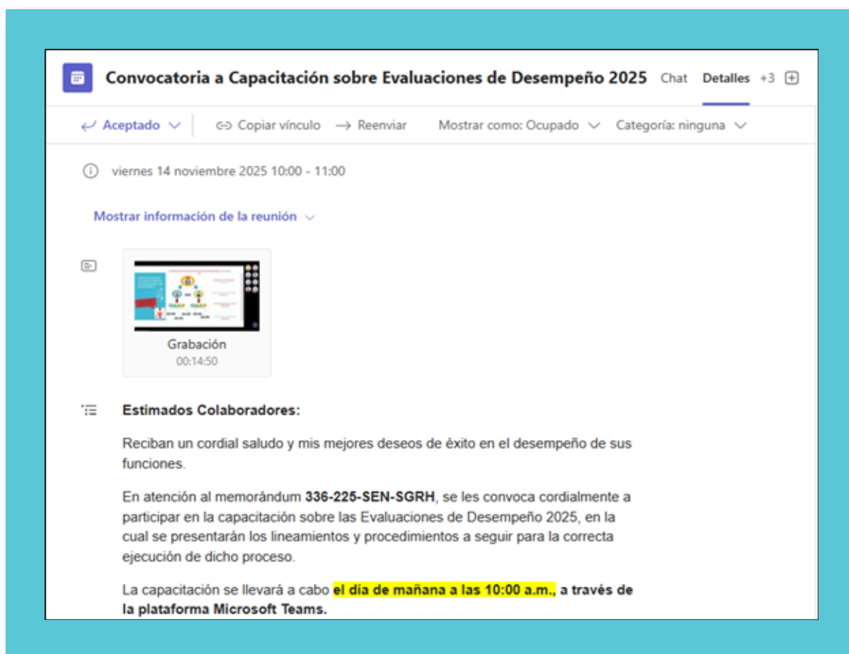
Ilustración 5: Capacitación Evaluación de Desempeño 2025

Se desarrollo la evaluación de desempeño bajo lo lineamientos descritos por la ANSEC, estas evaluaciones son fundamentales para el fortalecimiento institucional a través de la competencia técnica de sus servidores públicos para el beneficio de la población.