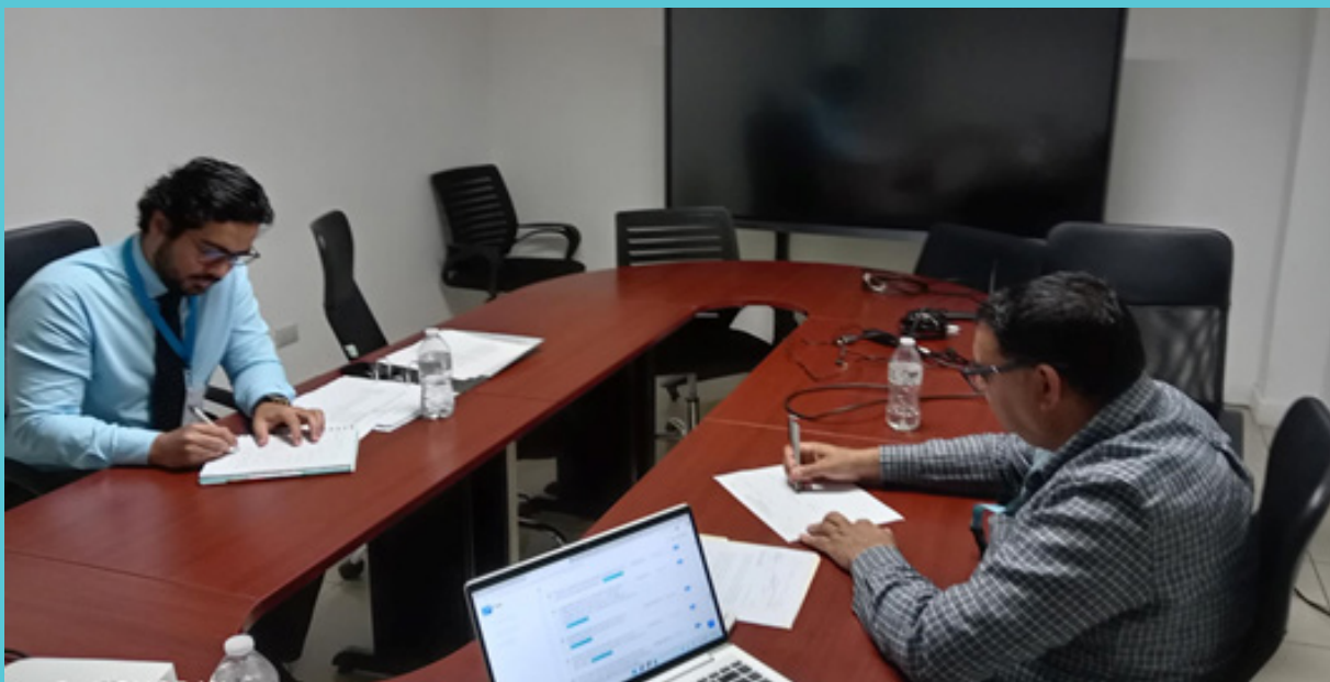
Ilustración 3: Reunión de trabajo Técnico de Verificación TSC y UPEG- SEN

La Secretaría de Energía, a través del seguimiento de los planes de acción que surgen de la rendición de cuentas en conjunto con el técnico de verificación de las recomendaciones supervisa que las acciones planteadas en los planes garanticen la mejora continua en la operatividad y administración de la SEN.