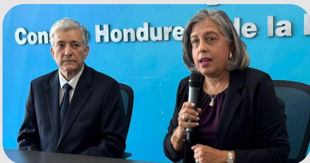
COHEP y SEN articulan esfuerzos para fortalecer el Sistema Eléctrico Nacional